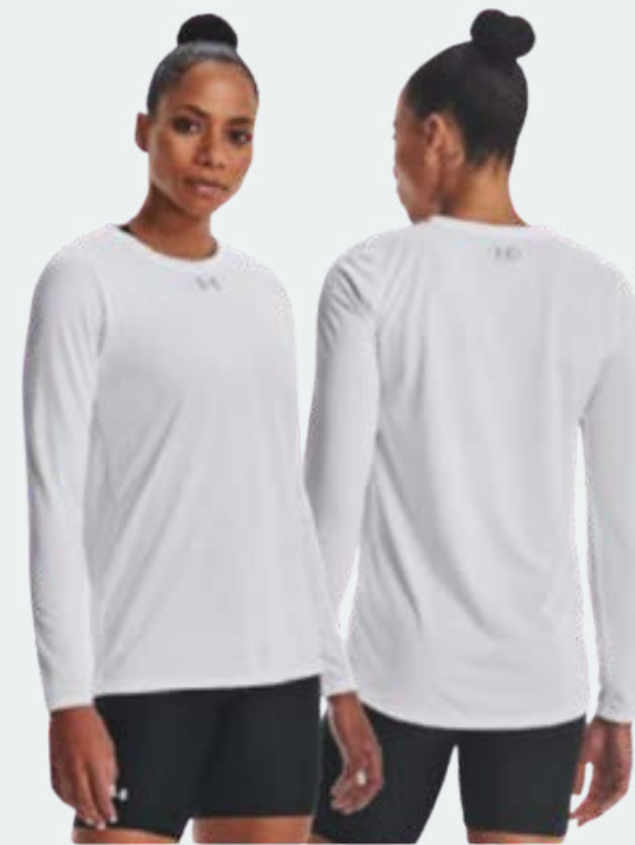
Chandail gris manche longue