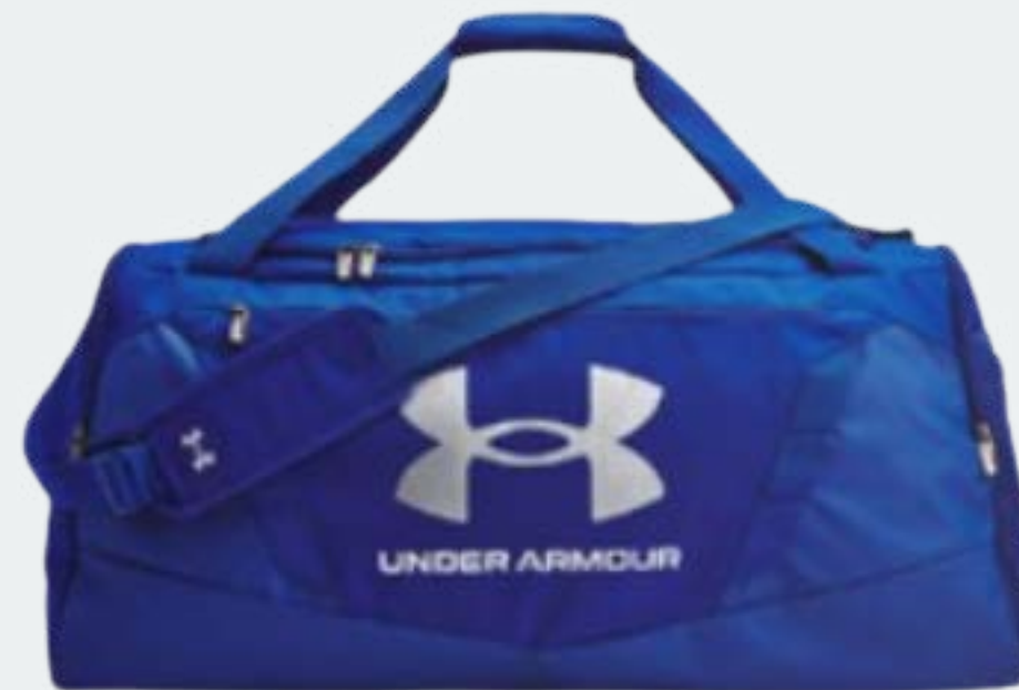
Sac bleu pour U13-U14