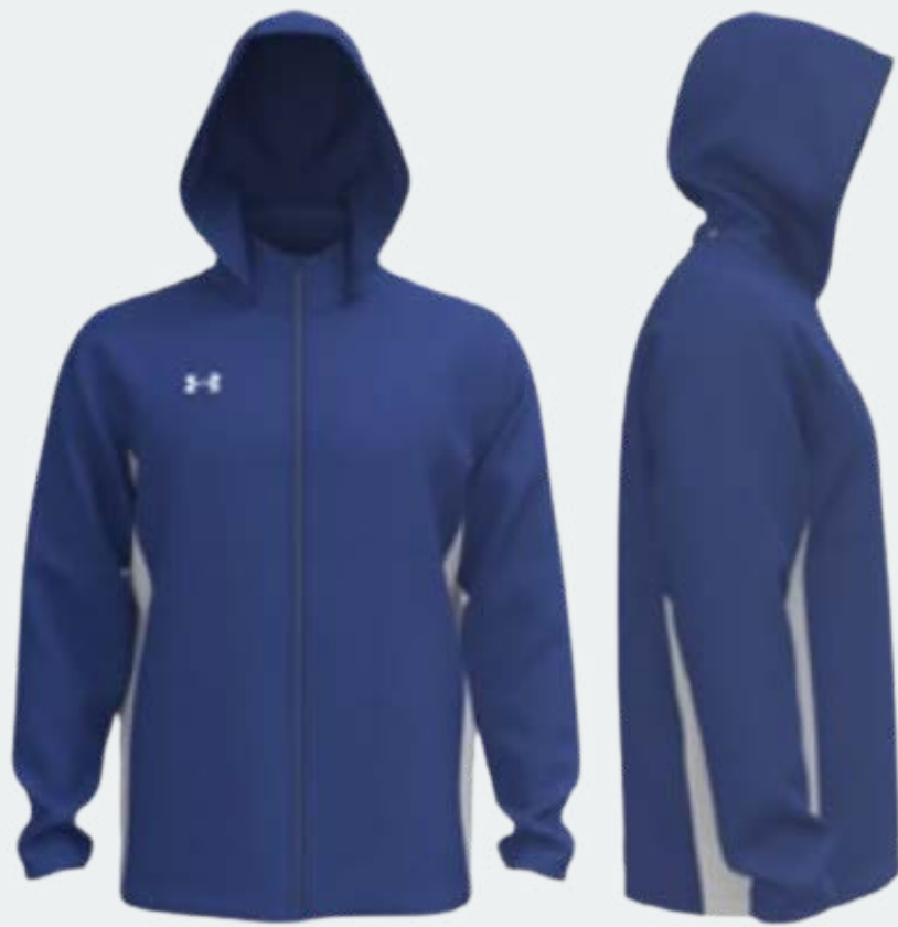
Jacket bleu avec initiales imprimées