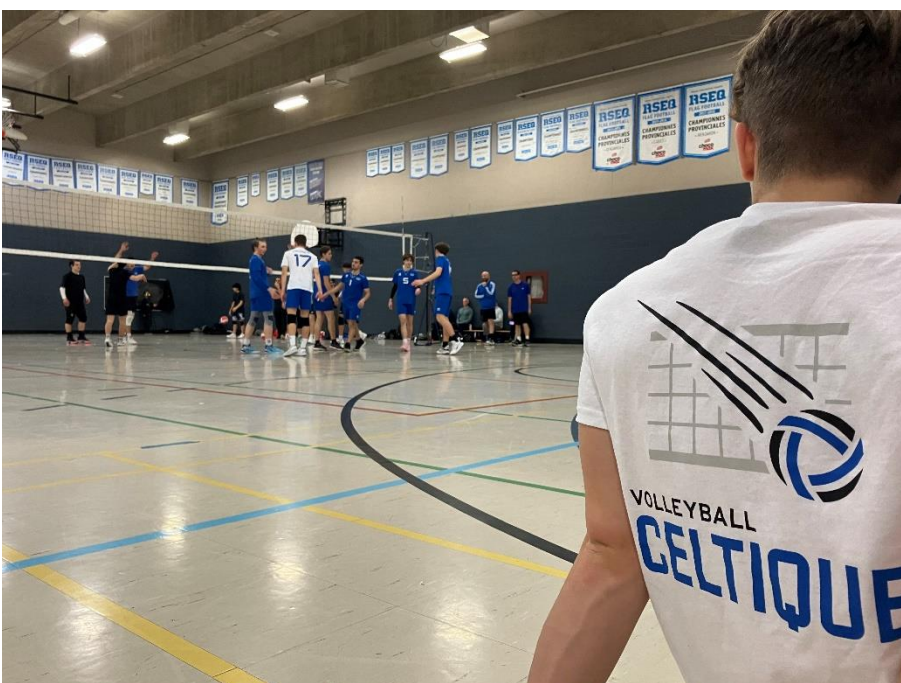
Dévoilement du nouveau logo aux équipes U16M, U17M et U18M à la pratique de Noël, décembre 2023