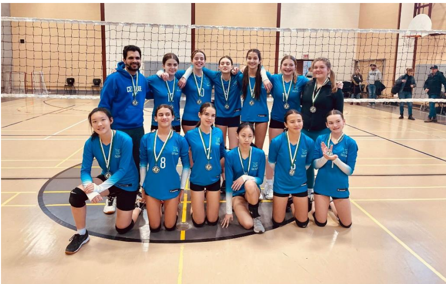
Equipe U14F Blanc, janvier 2024