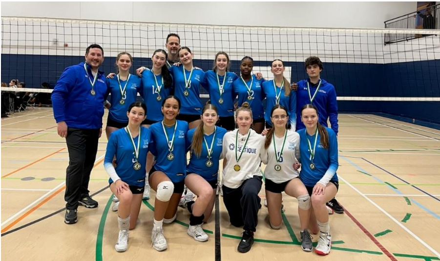
Equipe U16F Bleu, janvier 2024