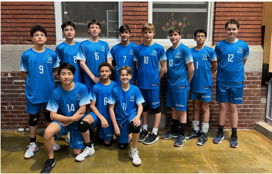
Equipe U14M, janvier 2024